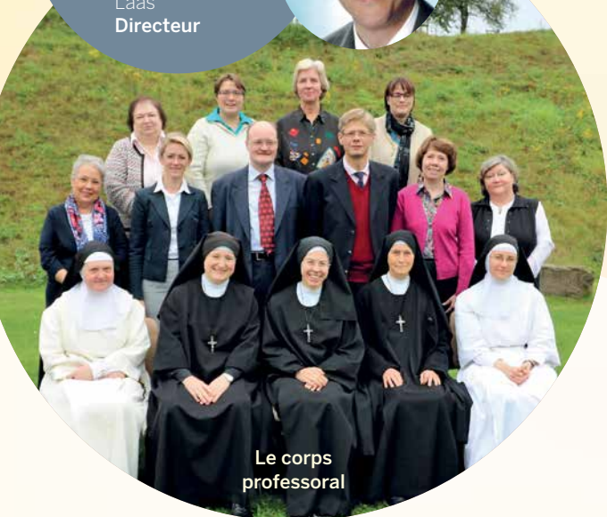
Le corps professoral

Nous proposons également aux futures élèves d'internat de passer quelques jours d'essai chez nous. Ainsi, sous la surveillance d'une éducatrice, vos enfants pourront participer à la vie de l'école, de l'internat et de ses loisirs.