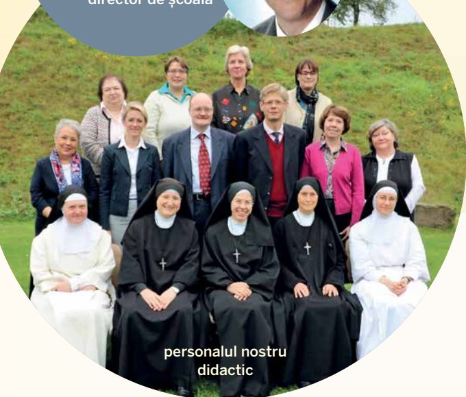
personalul nostru didactic

Elevilor care doresc să stea la internat le oferim și posibilitatea unor „zile de probă”. Astfel, sub supravegherea unei educatoare, copiii dumneavoastră pot participa câteva zile la viața din cadrul școlii, a internatului și din timpul liber.